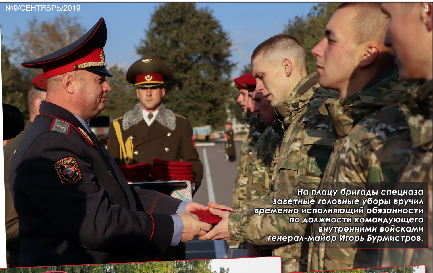
На плацу бригады спецназа заветные головные уборы вручил временно исполняющий обязанности по должности командующего внутренними войсками генерал-майор Игорь Бурмистров.